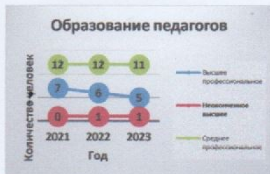
Диаграмма с характеристиками кадрового состава МБДОУ